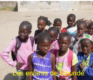
Les enfants de Moundé

Electrification de 2 écoles : L'équipe projet mène son travail avec efficacité. Voici son point d'avancement : « Pour le projet Siné Saloum: nous avons les devis pour les lampadaires solaires et les racks Lagazel. Nous attendons les devis de l'électricien pour compléter la matrice budget. La rédaction est en cours d'achèvement et nous finalisons les engagements de notre partenaire VSF et les comités de gestion des Ecoles, pour que les installations soient pérennes. Nous serons en mesure de présenter le projet au GAP fin avril. »