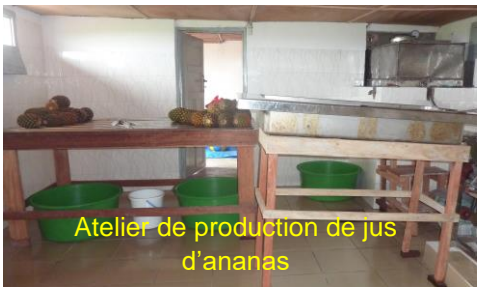
Atelier de production de jus d'ananas

Forage et adduction eau à Isbuma, électrification du collège : L'équipe projet s'est réunie à plusieurs reprises. La rédaction est en cours ainsi que les calculs de dimensionnement. Une consultation plus large pour le forage a été lancée. Objectif : présentation en commission des projets à l'automne